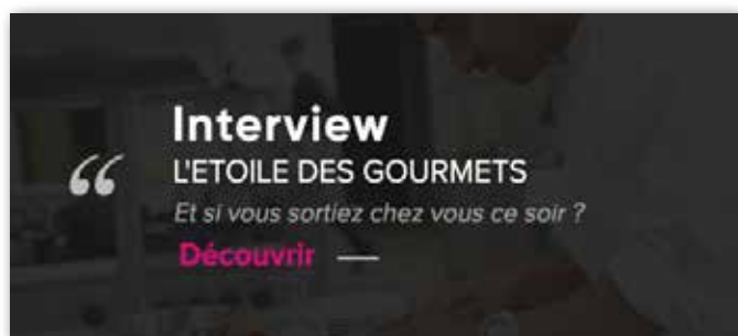
exemple d'interview personnalisée