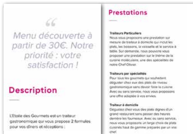
exemple d'une fiche traiteur

Nous favorisons le contact direct avec les internautes, pour que vous ayez tout en main pour les convaincre ! Vos futurs clients vous contactent soit par téléphone, soit par e-mail via une demande de devis ou un formulaire de contact. Votre site internet est en accès libre, pour plus de visibilité.